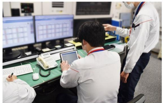
▲管理センターにて状況確認